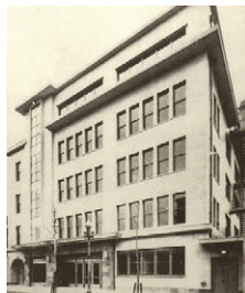
株式会社泷定商店成立