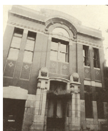
泷定合名会社成立、 同时开设大阪分公司