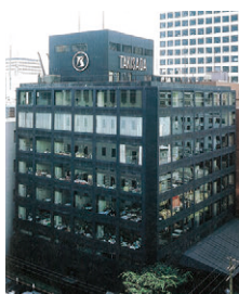
泷定株式会社分立， 设立泷定大阪株式会社